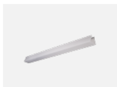
132-51100, K difuzor 2295 mm