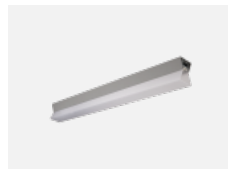
132-50031, B tubus závěsný 1000 mm