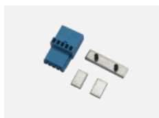
132-50201, F spoj přímý (pro stmívatelná sv.)