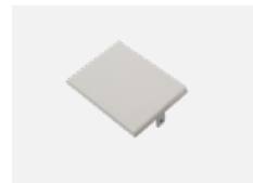
132-50100, B koncovka