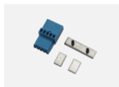
132-50201, F spoj přímý (pro stmívatelná sv.)