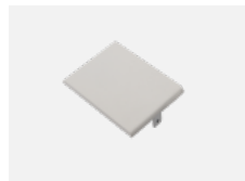
132-50100, S koncovka