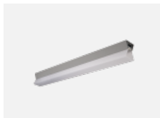
132-50031, S tubus závěsný 1000 mm