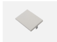
132-50100, S koncovka