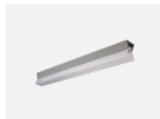
132-50031, S tubus závěsný 1000 mm