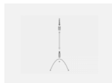
121-00301, N lankový závěs 4000mm -1 ks