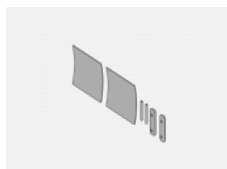
121-00200, N spoj přímý + propojovací kabel