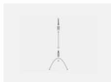
121-00300, N lankový závěs 2000mm -1 ks