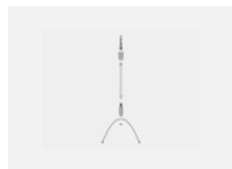
121-00302, N lankový závěs 6000mm -1 ks