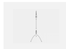
121-00301, N lankový závěs 4000mm -1 ks