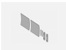
121-00200, N spoj přímý + propojovací kabel