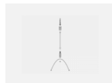
121-00301, N lankový závěs 4000mm -1 ks