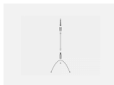
121-00300, N lankový závěs 2000mm -1 ks