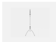
121-00300, N lankový závěs 2000mm -1 ks