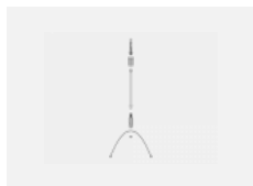
121-00302, N lankový závěs 6000mm -1 ks