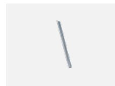
00-00363, K kabel 5x1,5 2000mm