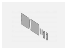
121-00200, N spoj přímý + propojovací kabel