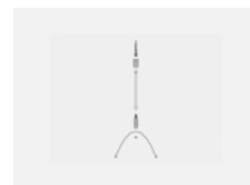
121-00301, N lankový závěs 4000mm -1 ks