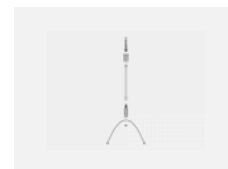
121-00301, N lankový závěs 4000mm -1 ks