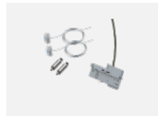
00-51301, W sada pro zavěšení do 3ř lišty, pro stmívatelná svítidla