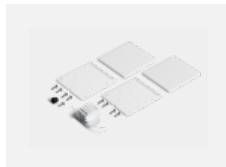
00-20103, W 2xkoncovka - plast, 5pól.svorkovnice, průchodka; Lipo80/Lina