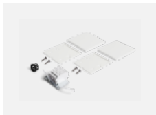
00-20101, W 2xkoncovka - kov, 5pól.svorkovnice, průchodka; Lipo80/Lina80