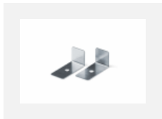
00-01200, F příslušenství k demontáži el. modulu z profilu