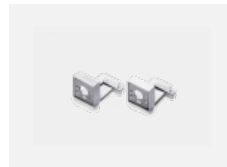
00-20700, W 2 ks úchytu na stěnu Lipo/Lina