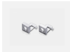
00-20700, W 2 ks úchytu na stěnu Lipo/Lina