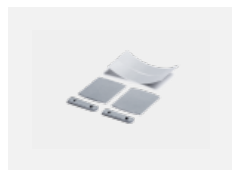
00-00200, N spoj přímý