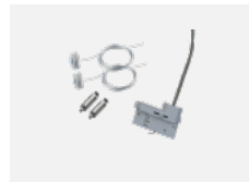
00-51300, W sada pro zavěšení do 3ř lišty, pro nestmívatelná svítidla