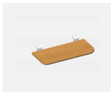
109-0004, WD polička