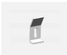
109-0001, F nástěnný úchyt