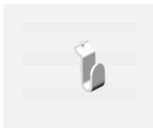
109-0003, W háček