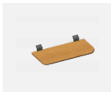
109-0004, BD polička