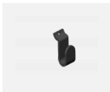
109-0003, B háček