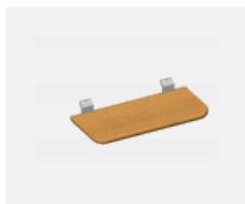
109-0004, SD polička