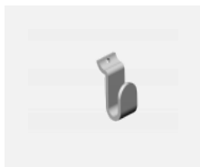
109-0003, S háček