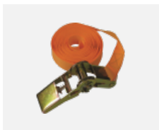
108-0004 stahovací pás pro kruhová svítidla INDI