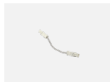
101-0011 propojovací kabel 3x 0,75 mm s konektory WAGO