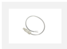
101-0013, W průhledný kabel 3x 0,75 mm, 2m s konektorem WAGO