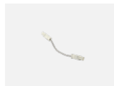
101-0011 propojovací kabel 3x 0,75 mm s konektory WAGO