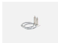
101-0008, N lankový závěs 2 lanka, 6000 mm