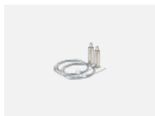
101-0007, N lankový závěs 2 lanka, 4000 mm