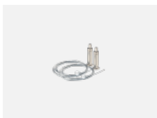
101-0002, N lankový závěs 2 lanka, 2000 mm