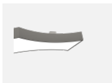
101-0001, W distance pro odsazení svítidel