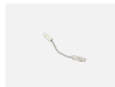
101-0011 propojovací kabel 3x 0,75 mm s konektory WAGO