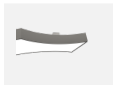
101-0001, W distance pro odsazení svítidel