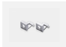
00-20700, S 2 ks úchytu na stěnu Lipo/Lina