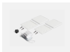
00-20101, S 2xkoncovka - kov, 5pól.svorkovnice, průchodka; Lipo80/Lina80