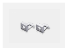
00-20700, W 2 ks úchytu na stěnu Lipo/Lina