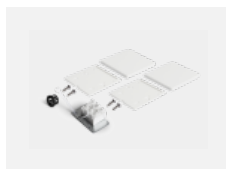
00-20100, W 2xkoncovka - kov, 3pól.svorkovnice, průchodka; Lipo80/Lina80