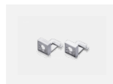
00-20700, W 2 ks úchytu na stěnu Lipo/Lina