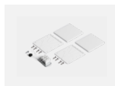
00-20102, W 2xkoncovka - plast, 3pól.svorkovnice, průchodka; Lipo80/Lina