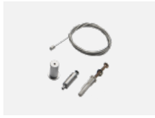
00-00300, N lankový závěs 2000mm -1 ks