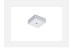
00-00370, W kalíšek stropní 80x80x32mm