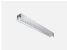
00-21300, W Lipo80-S, Lina80-S - modul pro lištová svítidla; l=1122mm