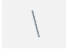
00-00363, K kabel 5x1,5 2000mm