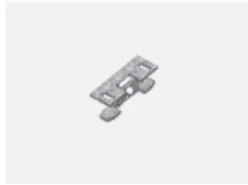
00-00600, F stropní úchyt pro svítidla 132-5xxK, 04-2000x, 05-2000x, 09-