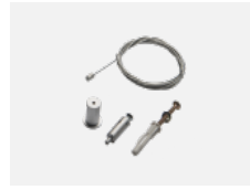
00-00302, N lankový závěs 6000mm -1 ks