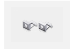
00-20700, W 2 ks úchyty na stěnu Lipo/Lina