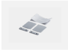
00-00200, N spoj přímý