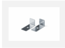
00-01200, F příslušenství k demontáži el. modulu z profilu