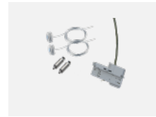
00-51301, W sada pro zavěšení do 3f lišty, pro stmívatelná svítidla