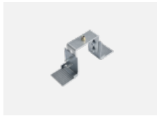
00-20900, F sada pro vestavbu závěsného profilu jako bezrámečková montáž