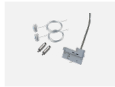
00-51300, W sada pro zavěšení do 3f lišty, pro nestmívatelná svítidla