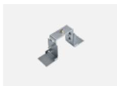
00-20900, F sada pro vestavbu závěsného profilu jako bezrámečková montáž