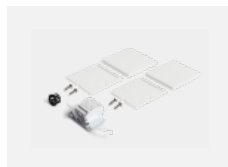
00-20101, W 2xkoncovka - kov, 5pól.svorkovnice, průchodka; Lipo80/Lina80