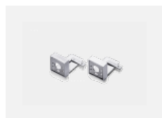
00-20700, W 2 ks úchytu na stěnu Lipo/Lina