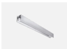
00-21300, W Lipo80-S, Lina80-S - modul pro lištová svítidla; l =1122mm