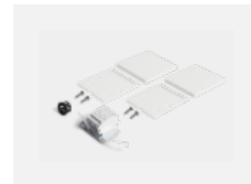
00-20101, W 2xkoncovka - kov, 5pól.svorkovnice, průchodka; Lipo80/Lina80