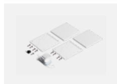
00-20103, W 2xkoncovka - plast, 5pól.svorkovnice, průchodka; Lipo80/Lina