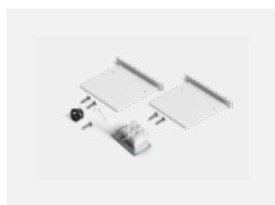
00-00100, W 2xkoncovka - kov, 3pól.svorkovnice, průchodka; Lipo80