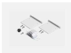
00-00101, W 2xkoncovka - kov, 5pól.svorkovnice, průchodka; Lipo80