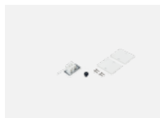
04-20100, W 2xkoncovka - kov, 3pól.svorkovnice, průchodka