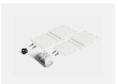
04-20102, S 2xkoncovka - plast, 3pól.svorkovnice, průchodka