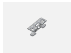
00-00600, F stropní úchyt pro svítidla 132-5xxK, 04-2000x, 05-2000x, 09-