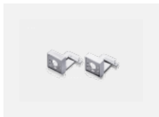
00-20700, S 2 ks úchytu na stěnu Lipo/Lina