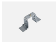
04-20900, F sada pro vestavbu zavěšného profilu jako bezrámečková montáž