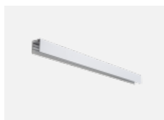
04-21307, W zavěšný modul pro lišťová svítidla; l = 2242mm