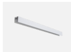
04-21303, W zavěšný modul pro lišťová svítidla; l = 1122mm