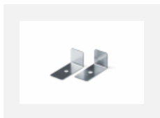
04-01200, F příslušenství k demonžáci el. modulu z profilu