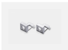
00-20700, W 2 ks úchytu na stěnu Lipo/Lina