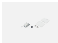
04-20100, W 2xkoncovka - kov, 3pól.svorkovnice, průchodka