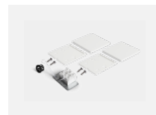
04-20102, W 2xkoncovka - plast, 3pól.svorkovnice, průchodka