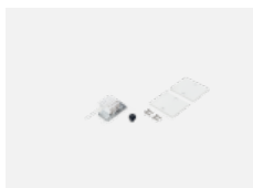
04-20101, W 2xkoncovka - kov, 5pól.svorkovnice, průchodka