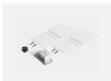
04-20102, W 2xkoncovka - plast, 3pól.svorkovnice, přůchodka