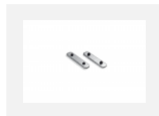
04-00200, N spoj přímý