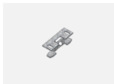
00-00600, F stropní úchyt pro svítidla 132-5xxK, 04-2000x, 05-2000x, 09-