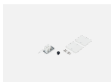
04-20100, W 2xkoncovka - kov, 3pól.svorkovnice, přechodka