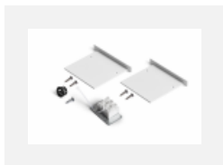
04-00100, W 2xkoncovka - kov, 3pól.svorkovnice, přúchodka